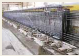
PCT桁 (プレテンション方式)