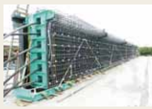
プレキャストセグメント桁