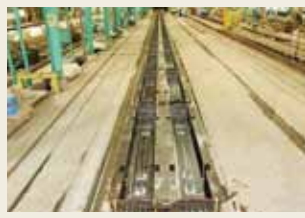
PCマクラギ (プレテンション方式)