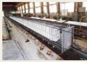
PCスラブ桁 (プレテンション方式)