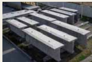
プレキャストセグメント桁