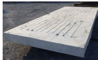
床版撤去後の供試体状況