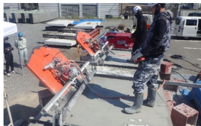
ずれ止め頭部の切断状況

実構造物と同規模の供試体を製作して、ずれ止め頭部の切断から RC 床版の分離・撤去までの一連の作業を実施し、作業速度や施工時の安全性に関して、想定した効果が得られることを確認しました。